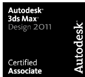
Certificazione rilasciata da Autodesk per 3D Studio Max